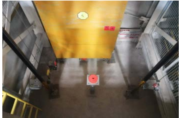
图片 1 (机房)、图片 2 (轿顶)、图片 3 (轿厢)、图片 4 (底坑)