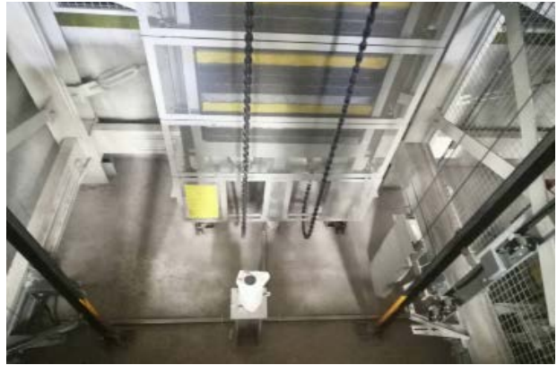
图片 1 (机房)、图片 2 (轿顶)、图片 3 (轿厢)、图片 4 (底坑)