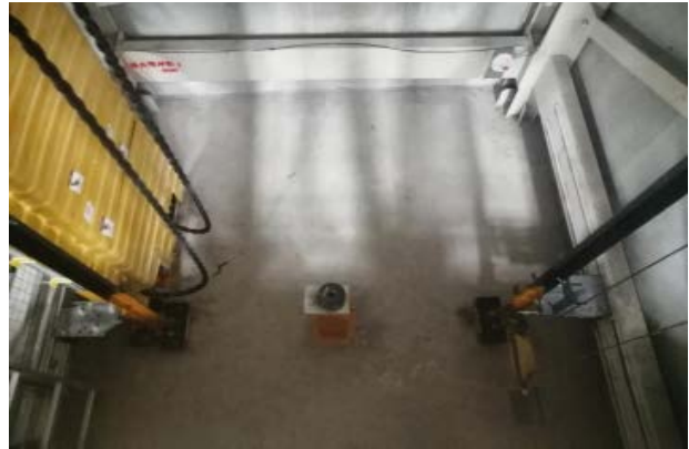
图片1 (机房)、图片2 (轿顶)、图片3 (轿厢)、图片4 (底坑)